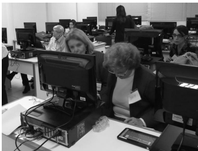
Figura 1 – Adultos mayores en clase de computadora en Río de Janeiro

Aunque varió un poco según los días, en promedio, se tuvo un grupo de 10 personas, de los cuales solo asistió un hombre. El promedio de edad fue de 75 años y el nivel socioeconómico, medio alto (C+ y B).