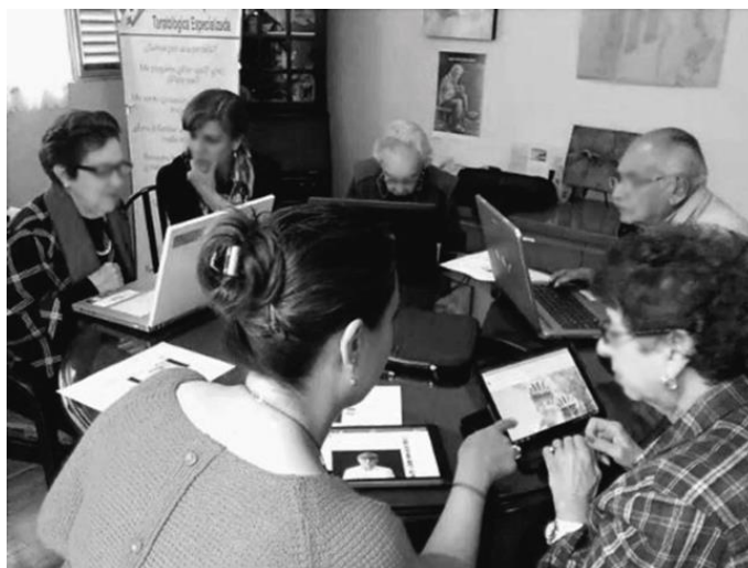
Figura 2 - Sesión en Abue's Club

La investigación etnográfica en AC duró un año, en la que se tuvieron sesiones con duración de hora y media, una vez a la semana. Durante ese período, seis personas con edad media de 85 años asistieron los encuentros con regularidad. Al final se realizó una entrevista individual a los tres integrantes más asiduos.