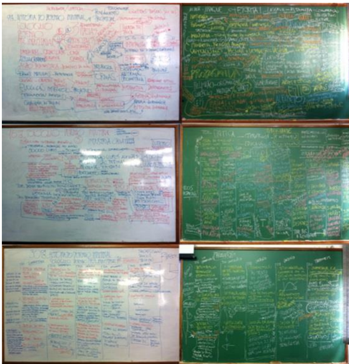
Figura 2: Quadros da sala após debates dos Colóquios de História do Desenho

A aula destinada aos Colóquios foi dividida em dois grandes momentos, tendo o intervalo como balizador. No primeiro momento, os estudantes foram estimulados a apresentar as três ideias retiradas e destacadas dos textos lidos e, com isso, foi desenvolvido um grande mapa mental no quadro branco / verde, com todas as ideias, interligando e conectando relações de proximidade entre tempos e movimentos da História, conforme pode ser visto na Figura 1.