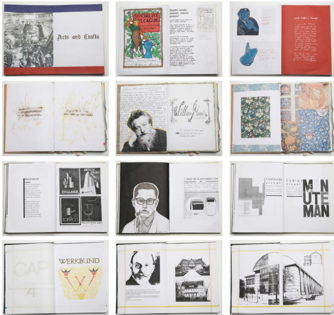
Figura 5: Diário Gráfico [T10] para Exposição de História [2015]

As propostas de Produtos Didáticos [T10A] também foram baseadas nos materiais reunidos para o Seminário no que diz respeito ao conteúdo. Cada GT definiu o tipo de produto, como por exemplo, uma revista, um aplicativo, uma série de pôsteres para apresentar visualmente o conteúdo pesquisado e estudado. Na Figura 5 alguns resultados.