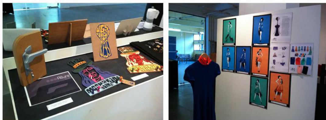
Figura 4: Propostas de produtos apresentados na Exposição de História em 2014

e Metodologia do Desenho Industrial [tmDi] e História do Desenho Industrial [hDi]. A Figura 4 mostra algumas propostas de produtos da disciplina de História do Desenho Industrial [2014].