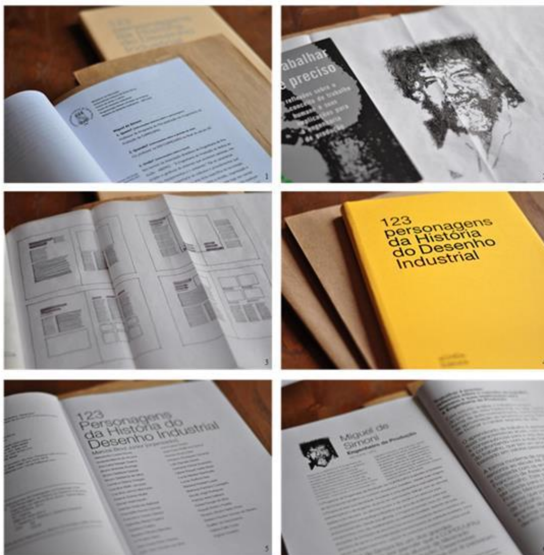
Figura 3: Pesquisa e Investigação para Miguel de Simoni no Seminário II de História do Desenho [2014.T10]

Na Figura 3 abaixo pode ser visto o processo de trabalho para a composição das páginas destinadas a Miguel de Simoni: (i) pesquisa linguística com as respostas para as perguntas Quem? Quando? Onde? O Quê? Por que? Como? Sobre o personagem e sua vida; (ii) investigação desenhística com ilustrações da face do personagem; e (iii) estudos de composição de páginas; (iv) um moca-pe físico do livro, pois há possibilidade dele ser impresso; (v) página com o nome dos estudantes; e (iv) um detalhe da página destinada a Miguel de Simoni.