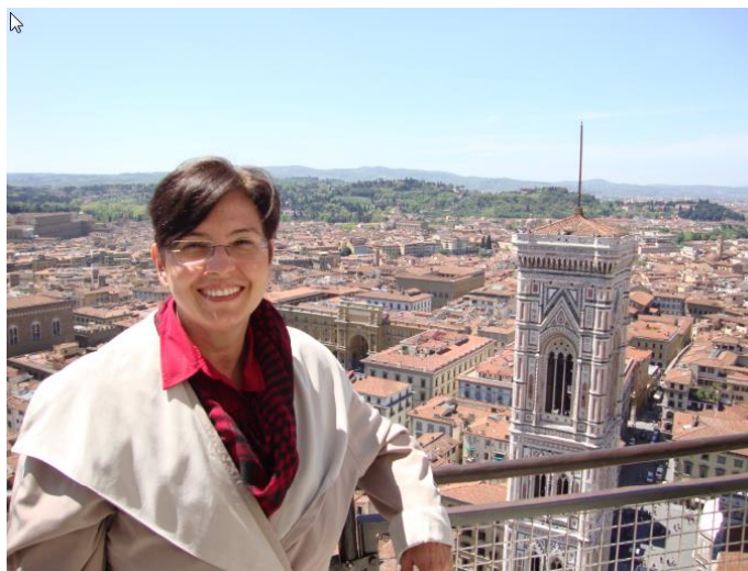
Figura 3: Imagem da persona construída

Em suas primeiras consultas com profissionais de saúde informa que é diabética. Te o costume de ler a bula de remédios prescritos para diabetes e quando possível pergunta suas dúvidas aos especialistas ou recorre a internet para sanar suas dúvidas.