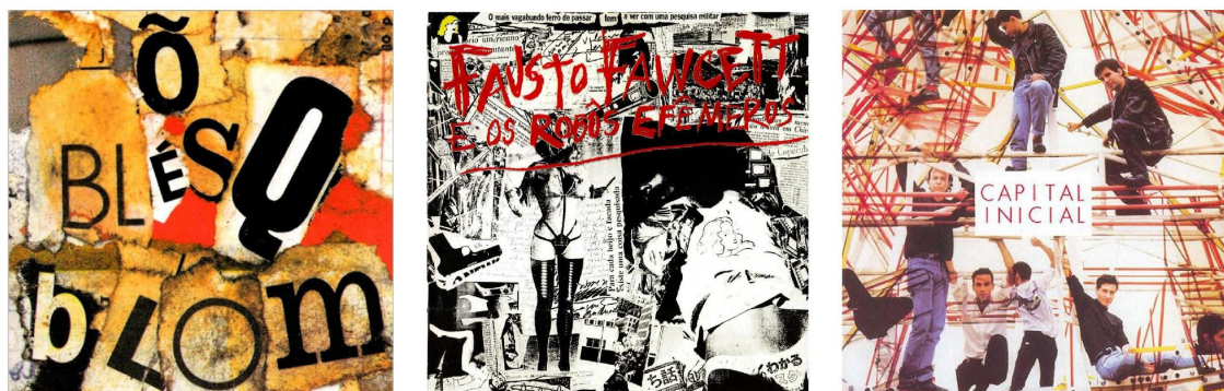
Figura 2: Capas de discos com colagens: Ô blésq blom / Titãs (Arnaldo Antunes, 1989), Fausto Fawcett e os Robôs Efêmeros / Fausto Fawcett e os Robôs Efêmeros (Jorge Barrão e Luiz Zerbini, 1987) e Você não precisa entender / Capital Inicial (Flávio Colker e Gringo Cardia, 1988)

Várias das capas pertencentes ao corpus examinado fazem uso de colagens como principal elemento pictórico. A maioria dessas capas se organiza com base na estrutura visual descrita anteriormente, isto é, dois elementos verbais dispostos sobre um elemento pictórico. Nesse subgrupo de capas que se fazem valer do recurso da colagem, podem ser observadas algumas tendências estéticas; entre elas destacam-se as colagens tipográficas, nas quais os elementos verbais foram usados para compor os elementos pictóricos (Figura 2, esquerda), as colagens em que se pode notar a influência da estética de fanzines da cena punk dos anos 1970 e 1980 (Figura 2, centro) e as colagens que buscam, através da sobreposição de elementos visuais, criar uma nova espacialidade (Figura 2, direita).