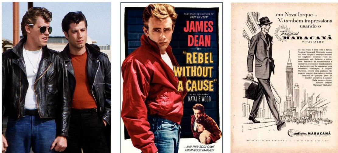
Figura 4: O revival dos anos 1950 com os atores Jeff Conaway e John Travolta em cena do filme Grease (autor não identificado, 1978) e as referências da época com Rebel without a cause / cartaz de cinema (autor não identificado, 1955) e Tropical Maracanã / anúncio de revista (autor não identificado, c. 1950)

Fontes: imdb.com (filmes correspondentes) e mixpp.blogspot.com/2010/04/propaganda-antigas.html, acessos em 30/9/2022.